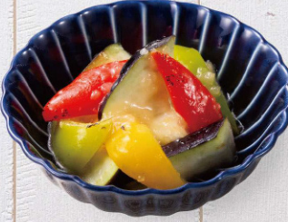
泉州水なすとパプリカのマリネ ~レモンジンジャー風味~ Marinated water eggplant and paprika with lemon ginger flavor 580円(税込)