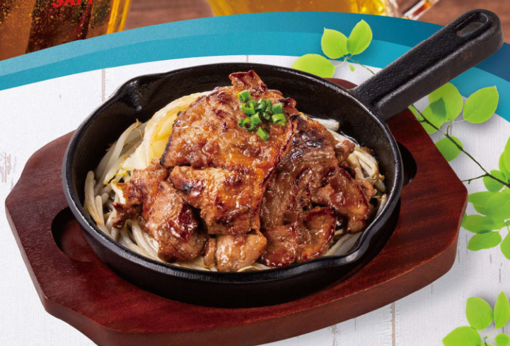
鉄板ジンギスカン Grilled lamb S 990円(税込) M 1,650円(税込)