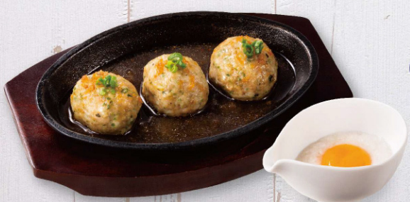
青唐辛子入りつくねの鉄板焼き ~黄身とろろ添え~ Hot green pepper in minced chicken with hot spring egg 880円(税込)