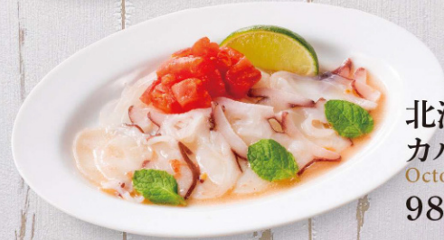
北海道水ダコの カルパッチョ Octopus carpaccio 980円(税込)