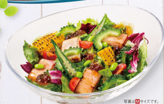
炙りベーコンと夏野菜のサラダ ~ボン酢ジュレ~ Summer vegetable salad S 680円(税込) M 1,080円(税込)