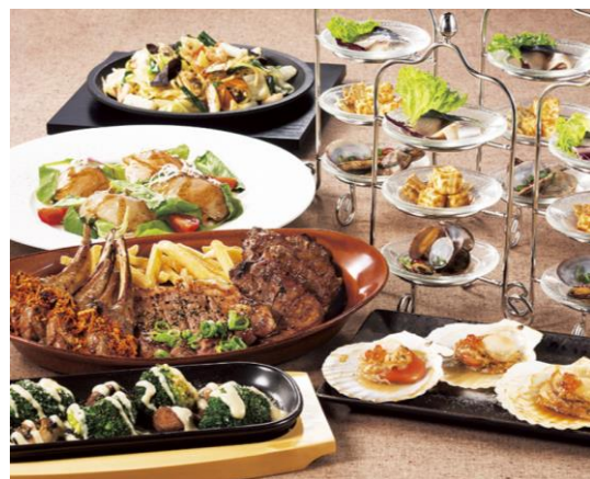
コース料理イメージ

11月7日～12月末の期間中、各コース通常 4,980 円・5,980 円のところ、4,000 円・5,000 円（税込）にてご用意します。