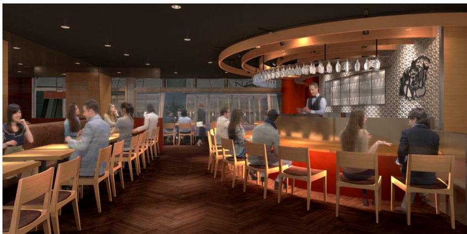
店内イメージパース

「JOY OF LIVING－生きている喜びの提供－」を企業理念に、ビヤホール・レストランなどを運営している株式会社サッポロライオン（本社・東京都渋谷区、社長・三宅祐一郎）は、南海本線 難波駅すぐにある商業施設「なんば CITY」の南館1Fに2019年11月7日（木）「YEBISU BAR The Grill なんば CITY 店」をオープンします。