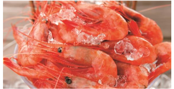
甘海老のこぼれ盛り