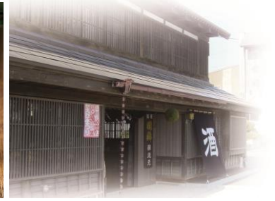
日本最北端の酒蔵「国稀酒造」