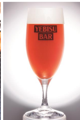
静岡レッドアイ 紅富士 680円