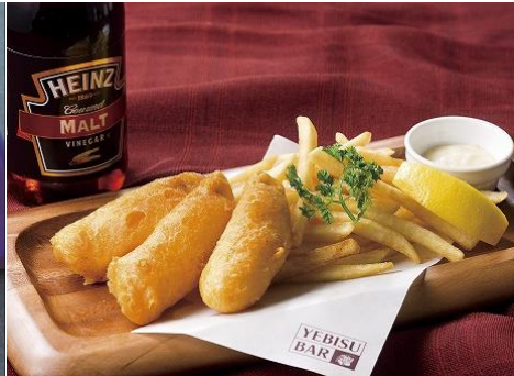
真鯛のフィッシュ&チップス