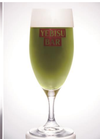
抹茶香るエビス 夏富士 650円