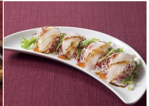
真鯛のカルパッチョ 昆布のソース