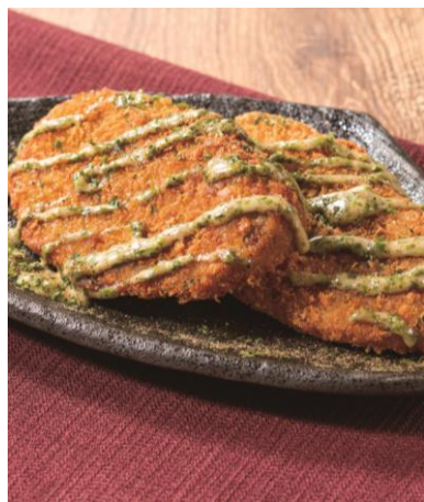
黒はんぺんフライ だし粉マヨソースで 550円

静岡名物の黒はんぺんや、しらすを使用したメニューも揃え、観光で静岡を訪れるお客様にも楽しんでいただけるラインアップです。ご当地ビヤカクテルメニューには、静岡県菊川産のあかでみトマトを丸ごとしぼったトマトジュースでつくる「静岡レッドアイ 紅富士」と静岡生まれの方には、うす茶糖の呼び名でなじみ深い定番ドリンクを使用した「抹茶香るエビス 夏富士」をご用意します。