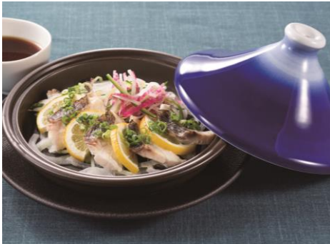
【アスティ静岡店限定】 真鯛の富士山タジン蒸し

また、樽生エビスの全ラインアップを取り揃え、表情豊かな各エビスの個性をより楽しんでいただくため“エビスと料理のマリアージュ”をメニューコンセプトに据え、それぞれの特徴に合わせた料理を提供しています。メニューブック上でも、各エビスのアイコンがつけられ、マリアージュを分かりやすく提案しています。