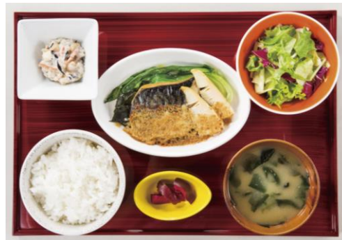
サバのごま味噌焼き御膳