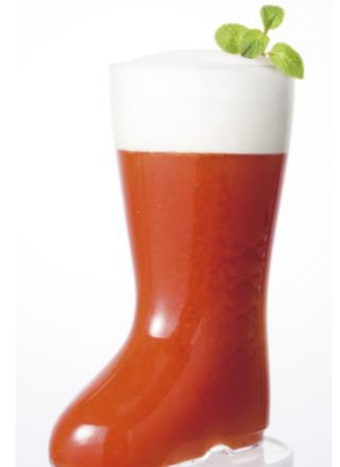
横浜レッドアイ ～小さな赤い長靴～