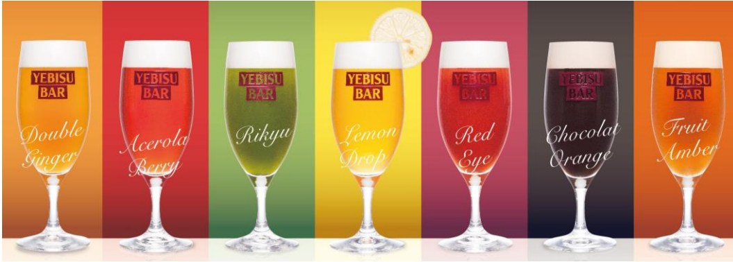
ビヤカクテルイメージ

またキュービックプラザ新横浜店では、新たに横浜の名物になるような、横浜が舞台の童謡をイメージした限定ビヤカクテル「横浜レッドアイ～小さな赤い長靴～」(648円)をご用意します。エビス生ビールにトマトピューレとライチのリキュールをまぜあわせたレッドアイをかわいらしいブーツグラスで提供します。甘く香りの良い味わいのため、おしゃれな横浜の街にピッタリの商品です。