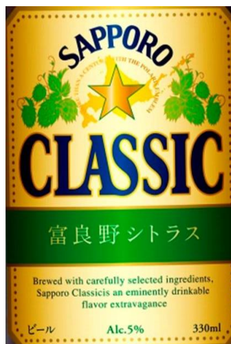
※クラシック富良野シトラス

「クラシック富良野シトラス」は、希少な富良野産ホップ「富良野 Beauty」を一部使用した、夏にふさわしい清々しくほんのり柑橘系（シトラス）の香りのする限定醸造のクラシックです。「THE サッポロビヤガーデン」で毎年限定販売しており、大変好評いただいています。本年は、平日 18:00 から、土日は 14:00 及び 18:00 から、それぞれ数量限定で販売し、毎日なくなり次第販売終了となります。