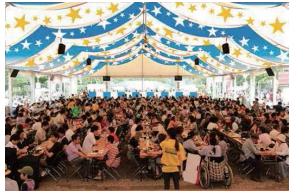
※今年の会場イメージ

「THE サッポロビヤガーデン」は、日差しの強い日中や雨天時でも、快適に過ごしていただけるカラフルな屋根の大型テントが特徴で、全天候に対応できるお席を約960席有します。その他、開放的なウッドベースのテラス席などもあり、全てで約2,500席と大きな会場のビヤガーデンです。また本年は、禁煙エリアを拡大します。