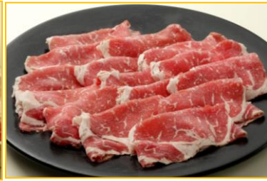
熟成サーロインしゃぶしゃぶ3,000円