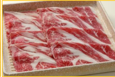
熟成国産牛しゃぶしゃぶ3,500円