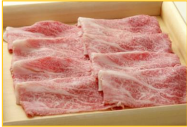
熟成黒毛和牛しゃぶしゃぶ4,000円

「熟成旨肉 六 (ROKU)」ではしゃぶしゃぶ用に国産黒毛和牛、国産牛、サーロイン (オーストラリア)、北海道産豚 (肩ロース、バラ) と5種類の熟成肉をご用意しています。お肉本来の味わいを楽しめるよう、シンプルな昆布出汁でしゃぶしゃぶします。