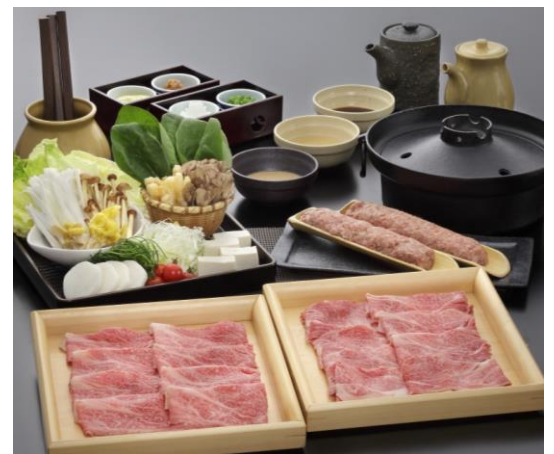
熟成黒毛和牛しゃぶしゃぶ食べ放題