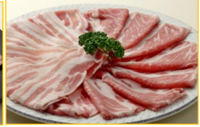
北海道産熟成豚盛合せしゃぶしゃぶ2,500円