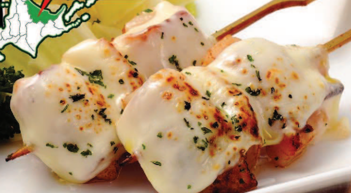
【紋別市】帆立貝ベーコン巻きチーズ串焼き 580円