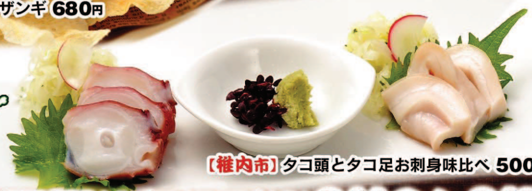
【稚内市】タコ頭とタコ足お刺身味比べ 500円