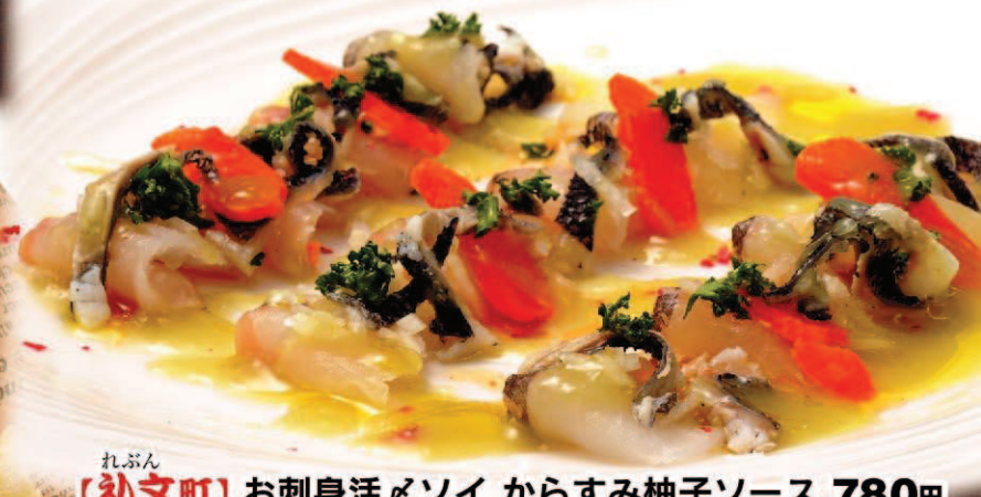
れぶん 【礼文町】お刺身活メソイ からすみ柚子ソース 780円