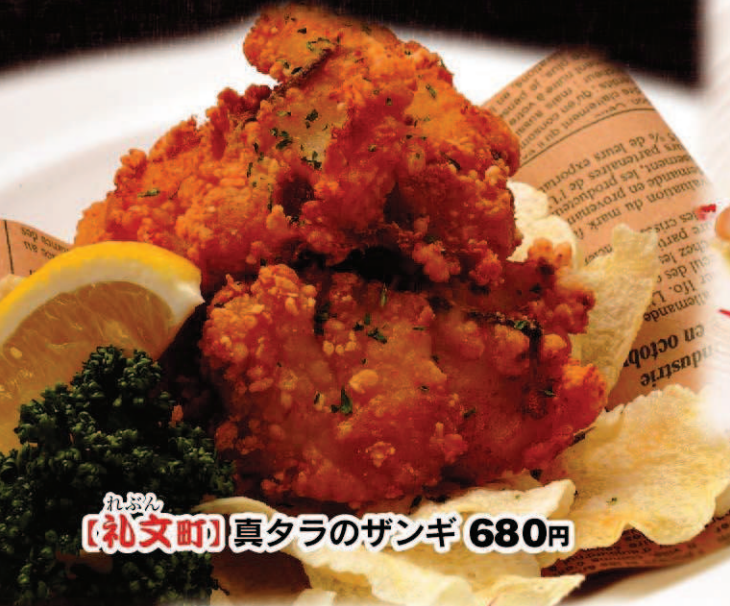
れぶん 【礼文町】真タラのザンギ 680円