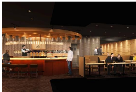
▲黒塚横丁店の店内イメージ 東京駅が近く全国のお客様にお立ち寄り頂きたいお店

店名：YEBISU BAR 黒塚横丁店 住所：東京都千代田区丸の内1-9-1 東京駅八重洲北口 B1F 黒塚横丁内 TEL：03-5220-4030 オープン日：2012年3月5日（月） 営業時間：11：00～23：00 規模：31.2坪／54席 平均予算：昼850円／夜2,500円 URL： http://r.gnavi.co.jp/g029006/ ※3月上旬開設予定