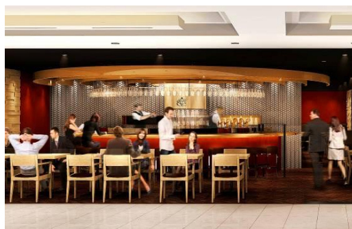
▲大崎店の店頭イメージ イスターカーテンを開けばオープンカフェ風になります

店名：YEBISU BAR 大崎店 住所：東京都品川区大崎1-6-5 大崎ニューシティ5号館2F TEL：03-3779-9321 オープン日：2012年3月14日（水） 営業時間：月～金 11：30～23：00 土日祝 11：30～22：00 規模：47.9坪／90席 平均予算：昼850円／夜2,500円 URL： http://r.gnavi.co.jp/g029005/ ※3月中旬開設予定