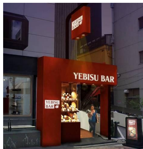
▲銀座二丁目店の外観イメージ エビスカラーで地下店内までいざないます

店名：YEBISU BAR 銀座二丁目店 住所：東京都中央区銀座2-5-7 GM2ビルB1F TEL：03-3561-5234 オープン日：2012年3月8日（木） 営業時間：月～金 11：30～15：00／17：00～23：00 土 11：30～23：00 日祝 11：30～22：30 規模：48.13坪／84席 平均予算：昼850円／夜2,500円 URL： http://r.gnavi.co.jp/g029007/ ※3月上旬開設予定